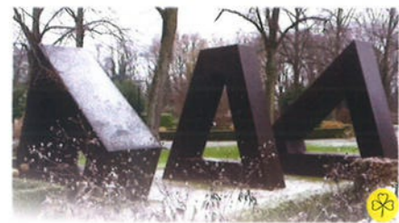
Sculptuur van corten staal (Els de Groot, Nijmegen 1940 - )