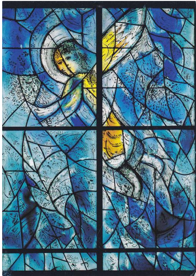
Glas-in-lood raam, Marc Chagall

Op de dag zelf ontvangt u een programma.