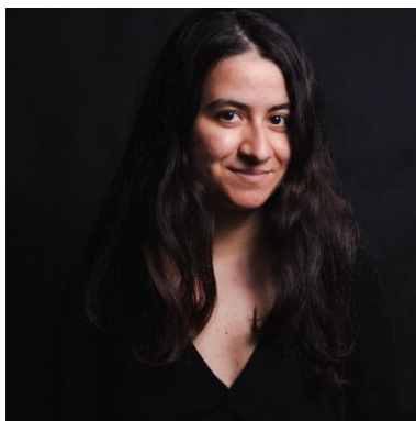
Sopraan Simona El-Sayed